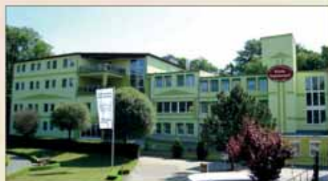
Haus mit Atmosphäre in grüner Umgebung