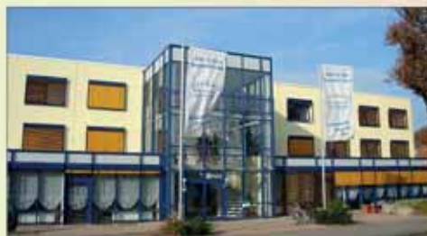
Mediterranes Flair in familiärer Atmosphäre